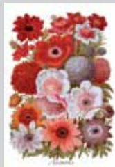
B. de Litardière

Exposition de 80 photographies, réalisées par Bernard de Litardière, des planches hors texte du dictionnaire en 6 volumes d'horticulture de G. Nicholson, conservateur des jardins royaux de Kew à Londres. Les planches d'origine, créées en 1898-1899, sont l'œuvre d'artistes anglais (gouaches reproduites par chromolithographies).